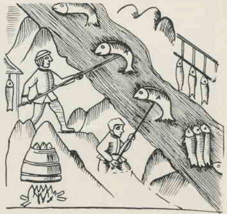
De piscatura Salmonum

Weiderhin huet den Ausonius op e puer Fösch higewiesen, de' definitiv aus onser Musel verschwonne sin. Mir nennen d'Langföschmudder, d'Elsen, d'Bläi-wäisser an och de Wels. Dese lescht genannte Fösch ass haut nach se'er häfech