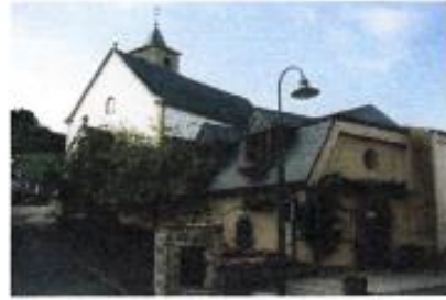
Gergeskeller, 44a Route du Vin (Wäistrooss)